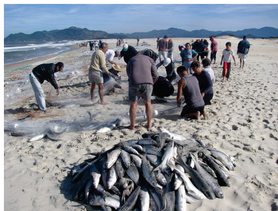
Pesca da tainha