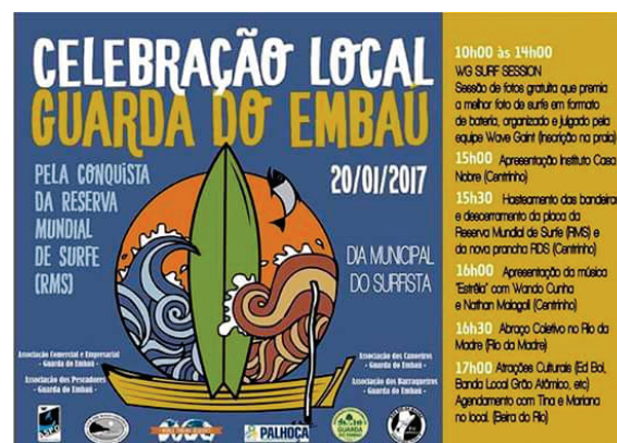
Evento realizado e patrocinado pelo restaurante Big Bamboo.

6- Apoio ao cultivo orgânico realizado por agricultores locais.