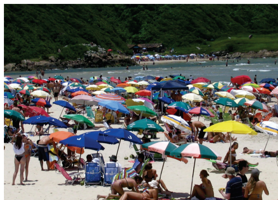
Década de 1990