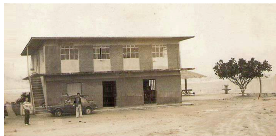
Década de 1970

Isto mudaria definitivamente a pequena e pacata vila de pescadores.