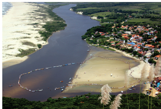
Abraço ao Rio da Madre.

Este importante programa uniu diversas entidades locais para a necessidade da preservação integral do rio da Madre.